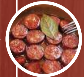
Chorizo a la sidra