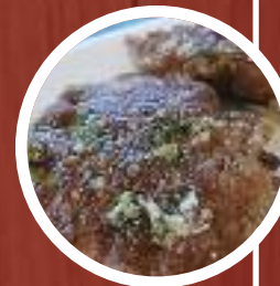
Carrilleras con salsa chimichurri