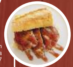
Chapatita recién de carrillera ibérica al 0'7