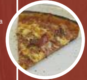
Pizza de la Casa