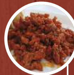
Chichas con adobo de la abuela