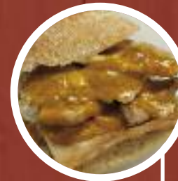
Pechuga con salsa de mostaza y miel