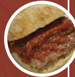
Solomillo con salsa Pedro Ximénez